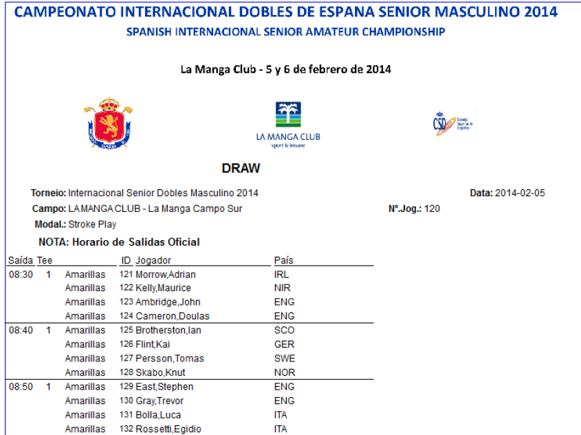
Imagen 7 Ejemplo de un horario de salidas con cabecera.

La nueva ventana (Imagen 6) nos muestra los distintos informes que realiza DataGolf y a la derecha aparece un desplegable con los distintos márgenes que tenemos configurados. Si seleccionamos uno de los márgenes tendremos ese reporte con la cabecera y el pie de página de la configuración seleccionada. Una vez seleccionado el margen del primer informe podemos copiar el mismo margen para el resto de informes, pulsando el botón de la derecha 'Copiar para todos'. Dándole al botón 'Grabar' tendremos los informes con sus márgenes configurados y listos para imprimir con las cabeceras y pie de páginas deseados.