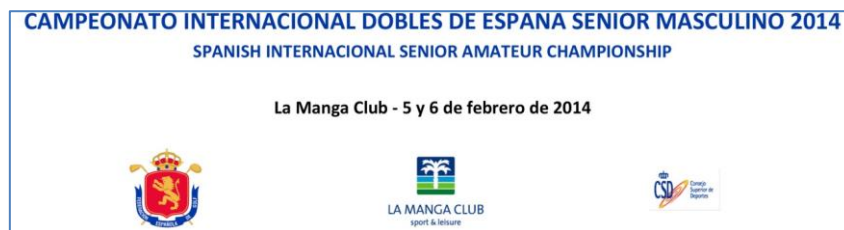
Imagen 1 Ejemplo de archivo gráfico para cabecera.

En la imagen de cabecera podemos incluir toda información que consideremos importante y todos los logos o imágenes que queramos, como se puede ver en la imagen 1.